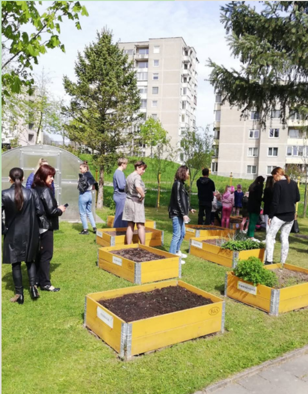
Picture5. Partner teachers observing an educational garden area at kindergarten "Volungele" in Alytus, Lithuania.